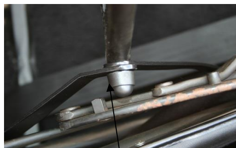
Das Gewinde des Windschotts wird mit den beiden Enden der Winkel verbunden und mittels selbstsichernder Mutter fixiert