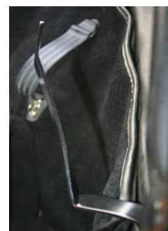
Unter der Schraube an dem die Persening befestigt wird, wird der L-Winkel befestigt