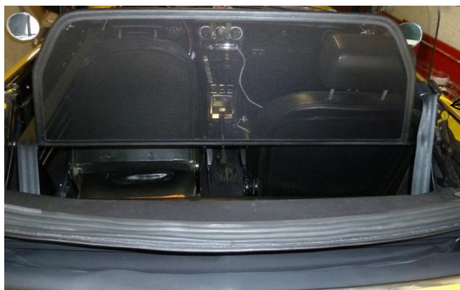
Gurt in die Gurtführung

es wird ausschließlich WEYER Flame Stop Feingewebe – Geprüft vom TÜV Nord nach DIN 75200 verarbeitet (Bericht Nr.:2003-11-Mi-0011)